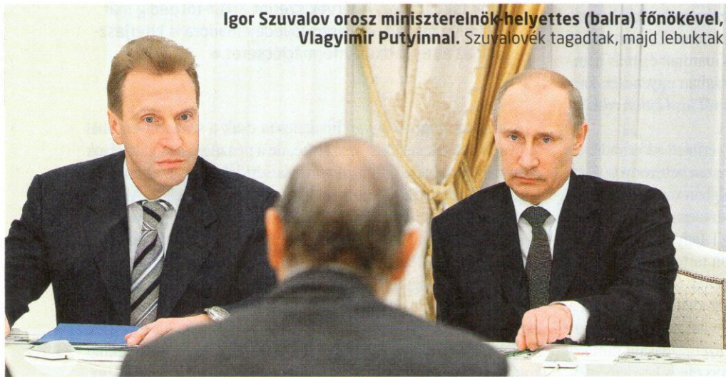
Igor Szuvalov orosz miniszterelnök-helyettes (balra) főnökével, Vlagyimir Putyinnal. Szuvalovék tagadtak, majd lebuktak

Adómentesként ajánlotta több neves hazai tanácsadó cég azt a struktúrát is, amikor egy magyar társaság valójában