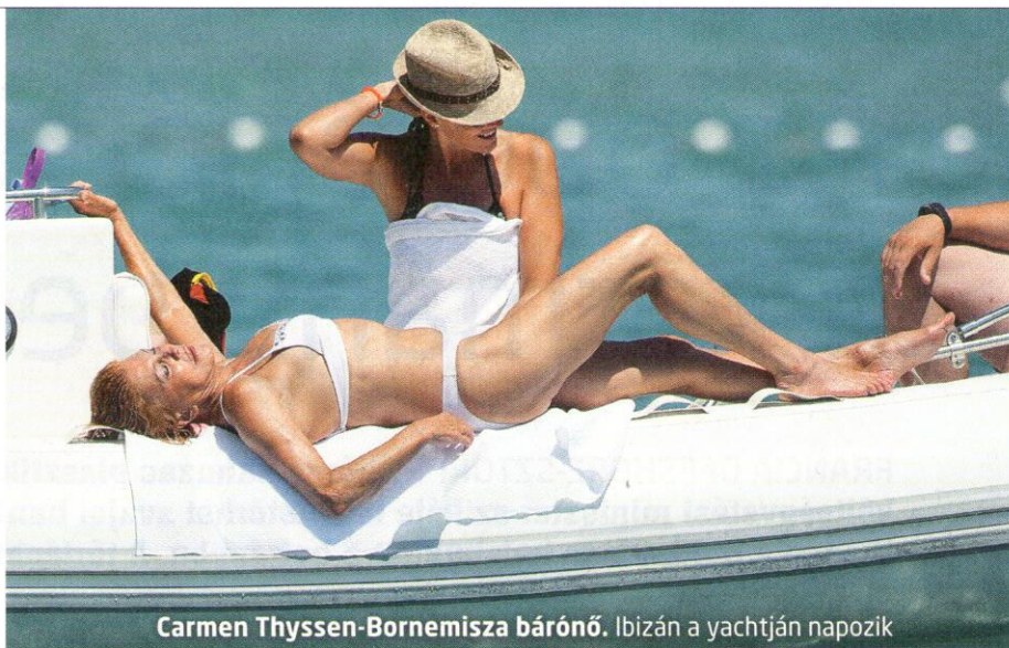
Carmen Thyssen-Bornemisza bárónő. Ibiza-n a yachtján napozik

A FATCA sikere annyira megtetszett a francia, a német, az olasz, a spanyol és a brit pénzügyminiszternek, hogy elhatározták, minden uniós országot meghívni egy hasonló programba, amely révén pár éven belül az EU-ban is hasonló automatikus információcsere lesz a tagállamok között. Dublinban, az április 11–13-i pénzügyminiszteri és központi banki vezetői tanácskozás végén Belgi-